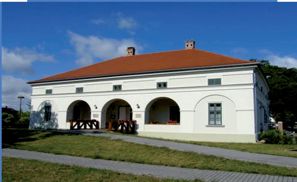
Kép: Kiszombor, Rónay-kúria