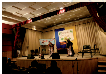
Nappali Ellátás dolgozói

A 2013. október 4. napján az Ady Endre Művelődési Házban a TALENT Tehetségkutató Énekstúdió és a NAPRAFORGÓ Idősök Klubja által nyújtott színvonalas előadást ezúton is köszönjük az előadónak.