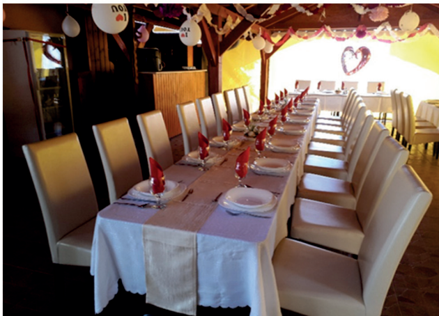
AQUA P'ART SZÁLLÁS, KEMPING, SZABADIDŐ-KÖZPONT, Óbébai u. külterület, 05401/2 hrsz.