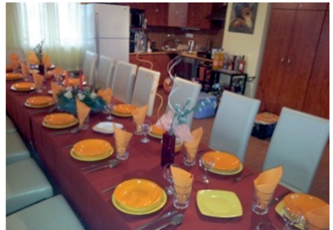
TÓ-PARTY PANORÁMA PANZIÓ Tó u. 2.

BALLAGÁS, BARÁTI-, CSALÁDI RENDEZVÉNYEK, ELJEGYZÉS, KISLAKODALOM, SZÜLETÉS- ÉS NÉVNAPOK, BULIK, OSZTÁLYTALÁLKOZÓK, CSOPORTRENDEZVÉNYEK, CSAPATÉPÍTŐ TRÉNINGEK, OSZTÁLYKIRÁNDULÁSOK, TÁBOROK, OKTATÁS, TERMÉKBEMUTATÓK... stb.