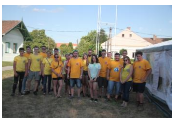
KIK – szervezők