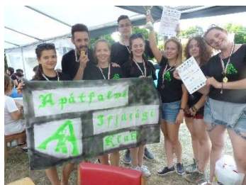
Apátfalvi Ifjúsági Klub