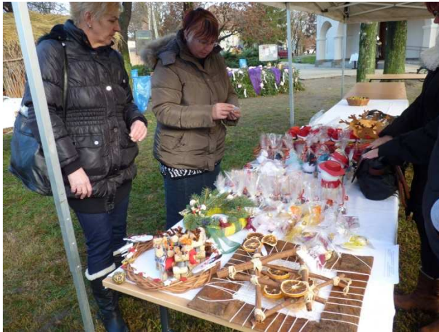
Az adományokból a csoportok játékfeltételeit bővítjük.

Rendszeres résztvevői vagyunk az Aranykapu vásárnak. Ez is egyike azoknak a települési szintű rendezvényeknek, amelyen a helyi civilek együttműködnek.