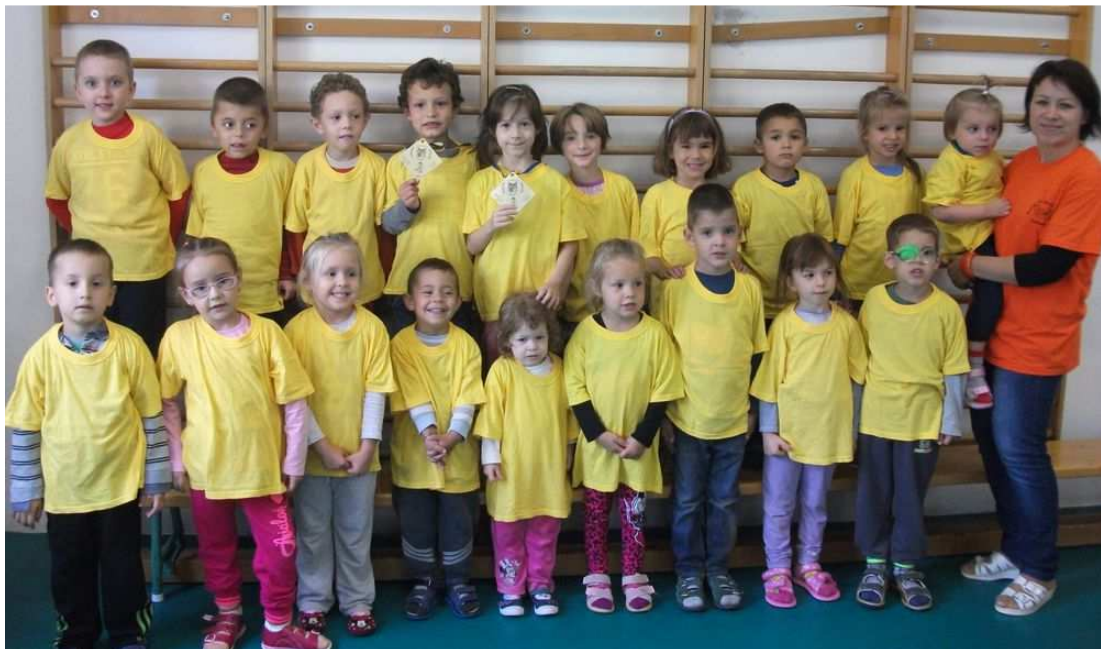
A Dózsa Vágta résztvevői