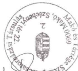
Farkas Éva Erzsébet elnök

ÖNKORMÁNYZATI TÁRSULÁS MAKÓ VÁROS ÉS TÉRSÉGE SZENNYVÍZCSATORNÁZÁSÁNAK ÉS SZENNYVÍZTISZTÍTÁSÁNAK MEGVALÓSÍTÁSÁRA 6900 Makó, Széchenyi tér 22. Adószám: 15358794-2-06 PIR azonosító szám: 358796 Bankszámlaszám: 12069000-01034807-00100008