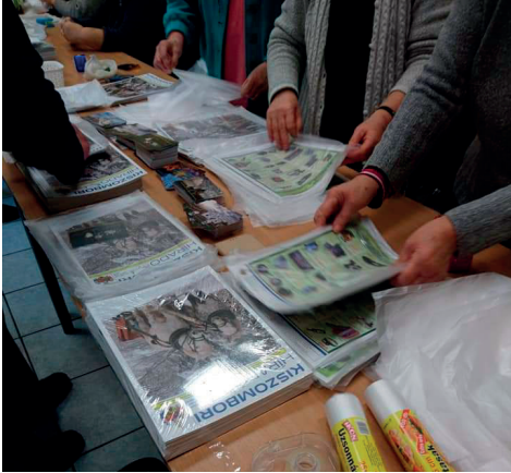
A kártyanaptár munkálatait közösen végezte a csapat.