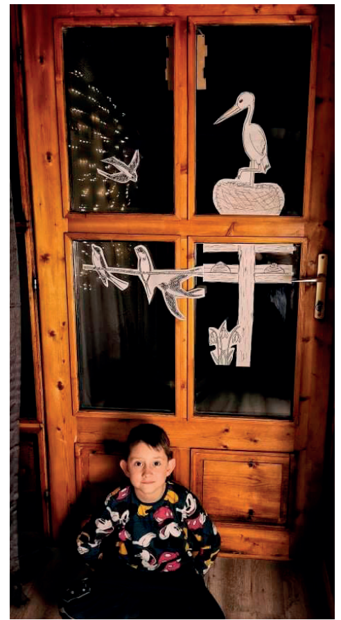
Tavaszwáró vetélkedőnkre két család lelkesen küldi a megoldásokat.

Ezen támogatásokat a jólelkű adományozók (fémhulladék, dobozok, pénzbeli adomány) és önkéntesek munkája nyomán tudja biztosítani az alapítvány.