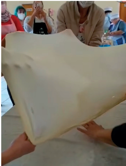
Hagyományos rétecsütést rendeztünk, melyen makói és szegedi érdeklődőkön kívül lelkes zomboriak is voltak.