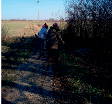
Tagságunk egy része a zombori természetbeparkolóba szervez sétákat, és közben a környezetvédelemre is figyelve szedik a szemetet.