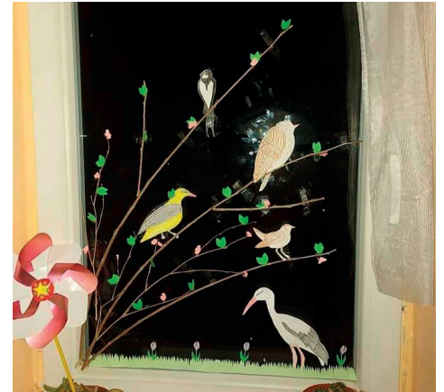
Tavaszwáró vetélkedőnkre két család lelkesen küldi a megoldásokat.