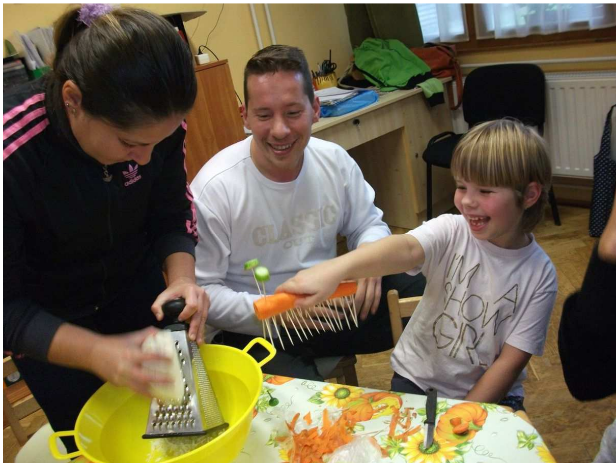
Honvédek az oviban