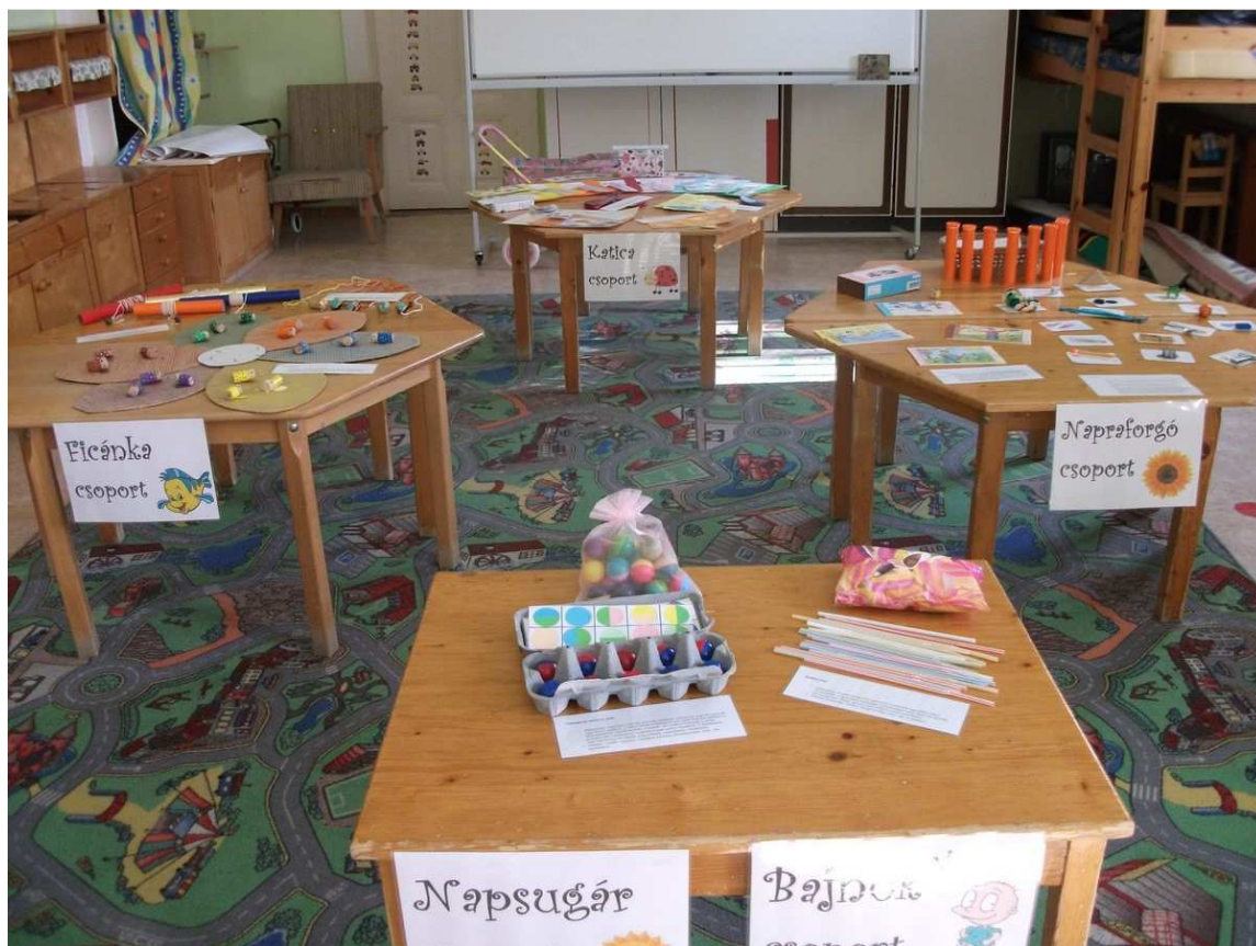
A saját készítésű játékokat ki is próbáltuk