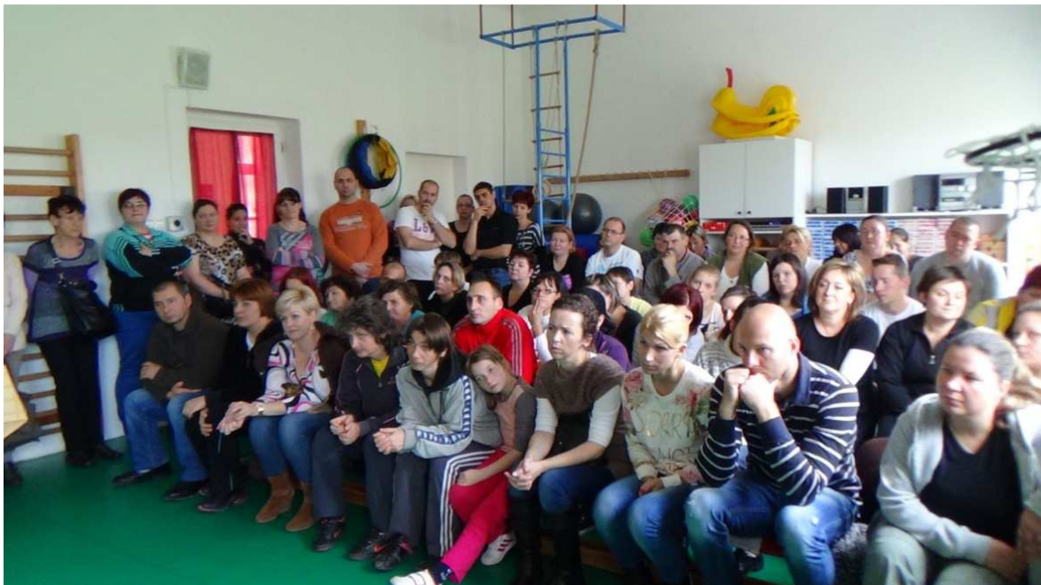
Vigyázzunk rájuk! - egészségmegőrző nap előadása