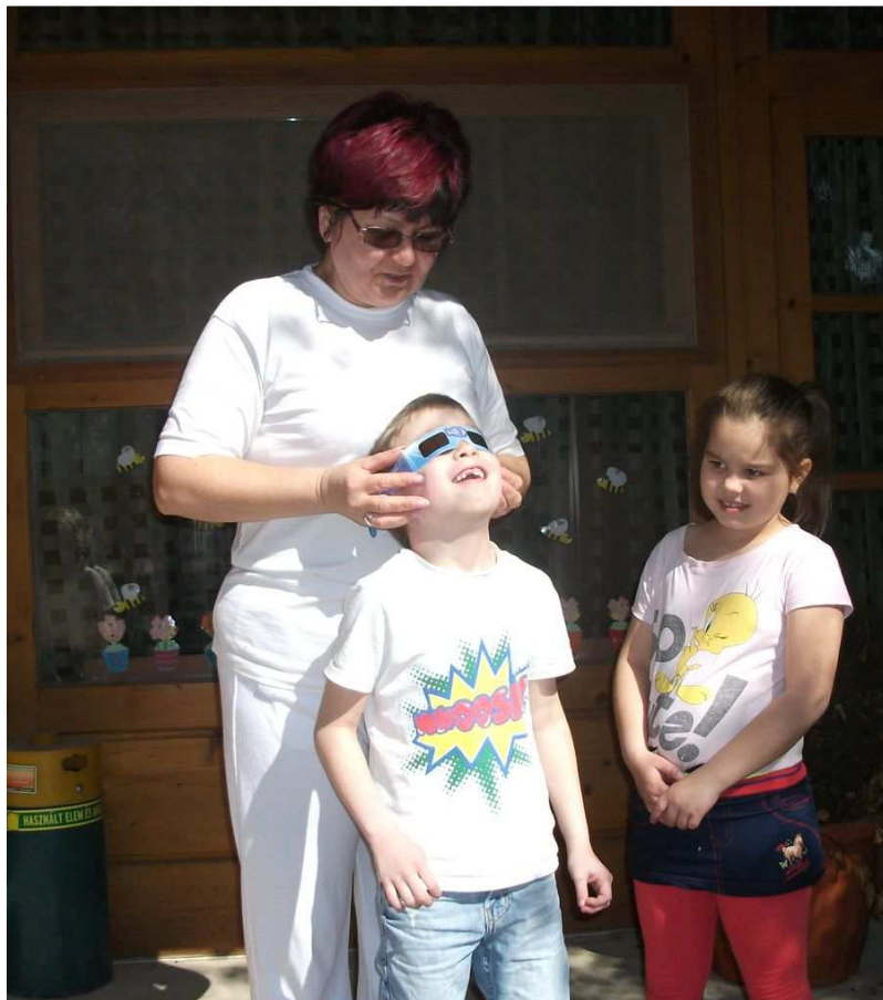
Mindenre kíváncsiak, és minden érdeklő őket! Ezt kellene sokáig megőrizni bennük!