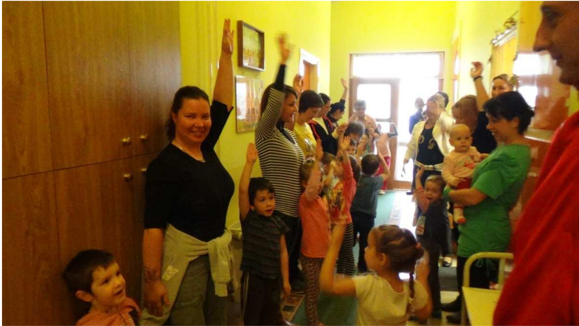
Közös torna az ovi folyosóján az ovi-rádió utasítása alapján