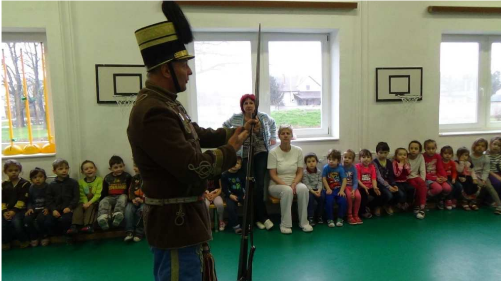
Eredményes a toborzás