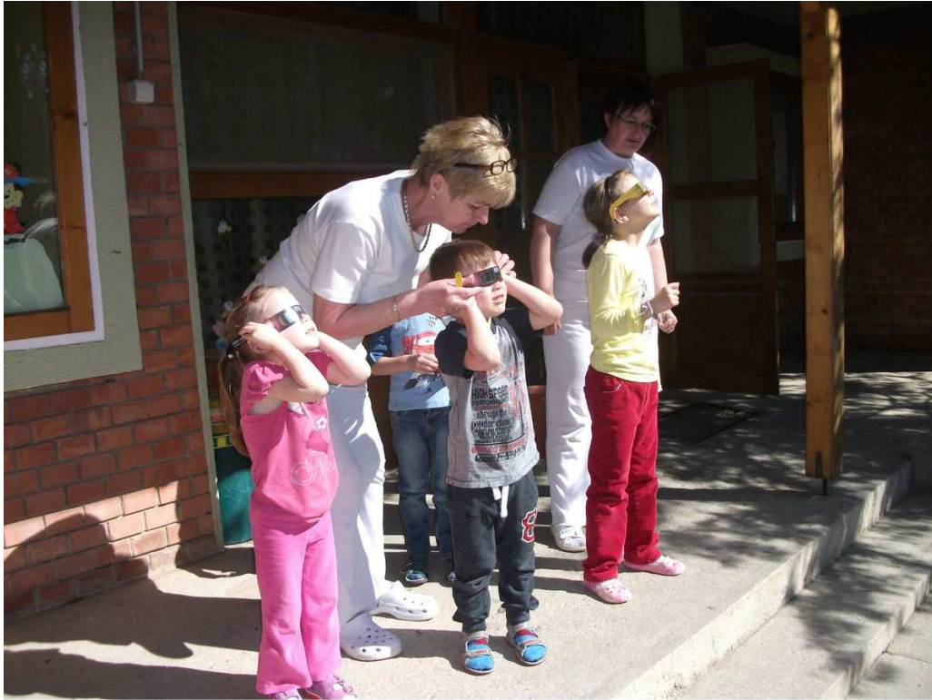
A részleges napfogyatkozást is megmutattuk a gyerekeknek