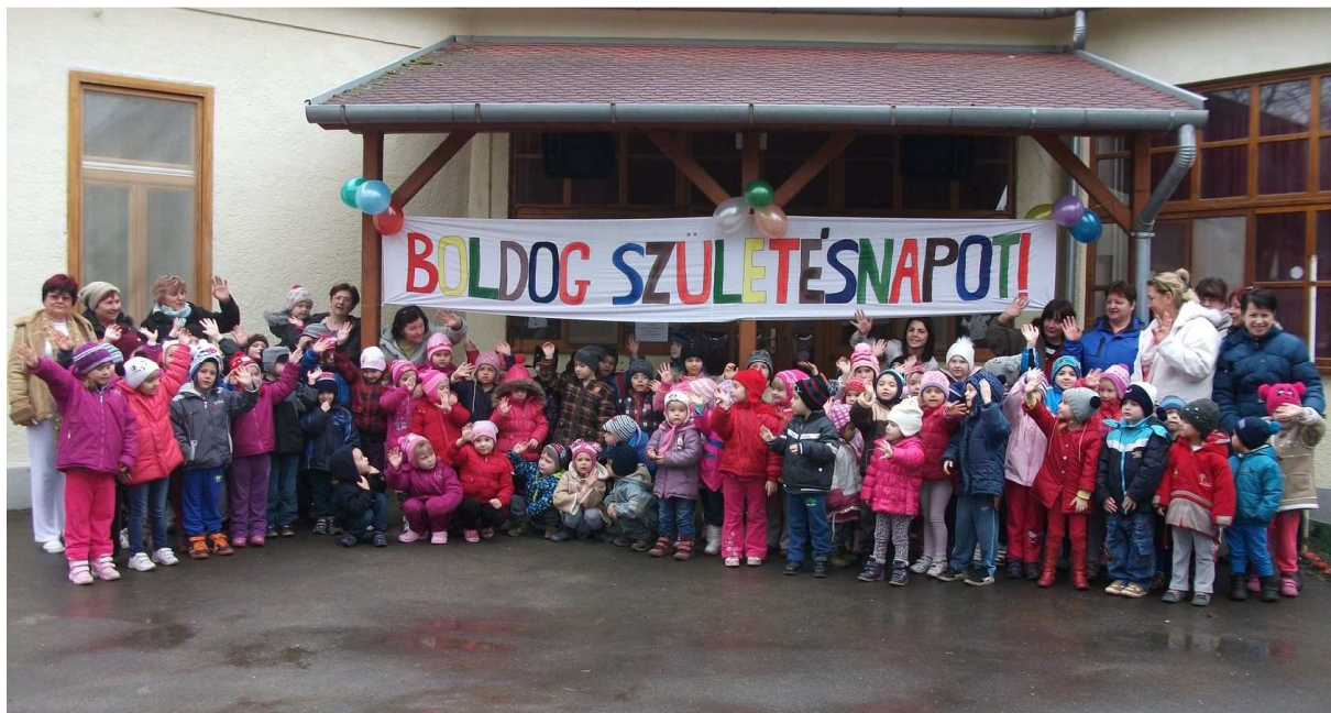
Ezen a napon az ovi szülinapja van! Már a 132.!!!!