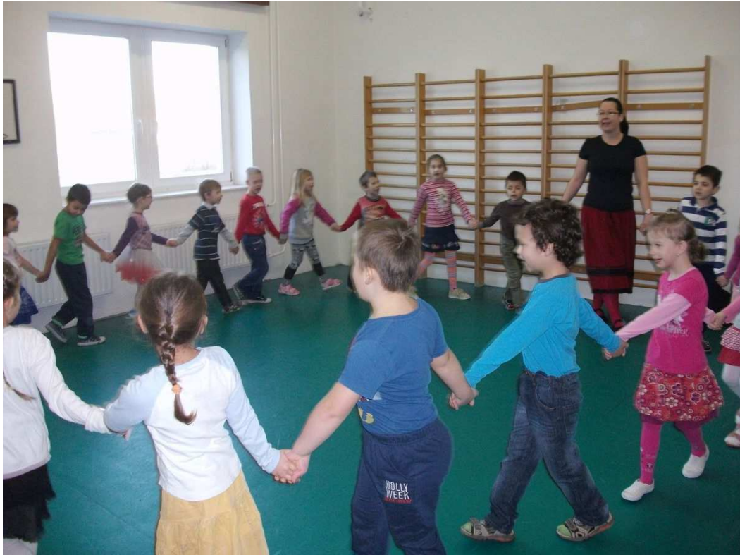
Táncba visszük őket