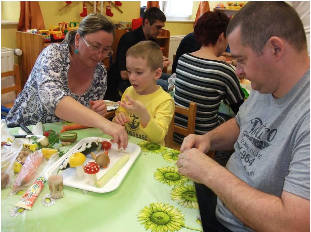
A legeslegjobb apuval és anyuval együtt alkotni az oviban is