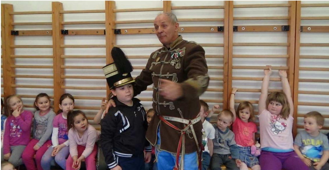
Kis huszárok a csatában