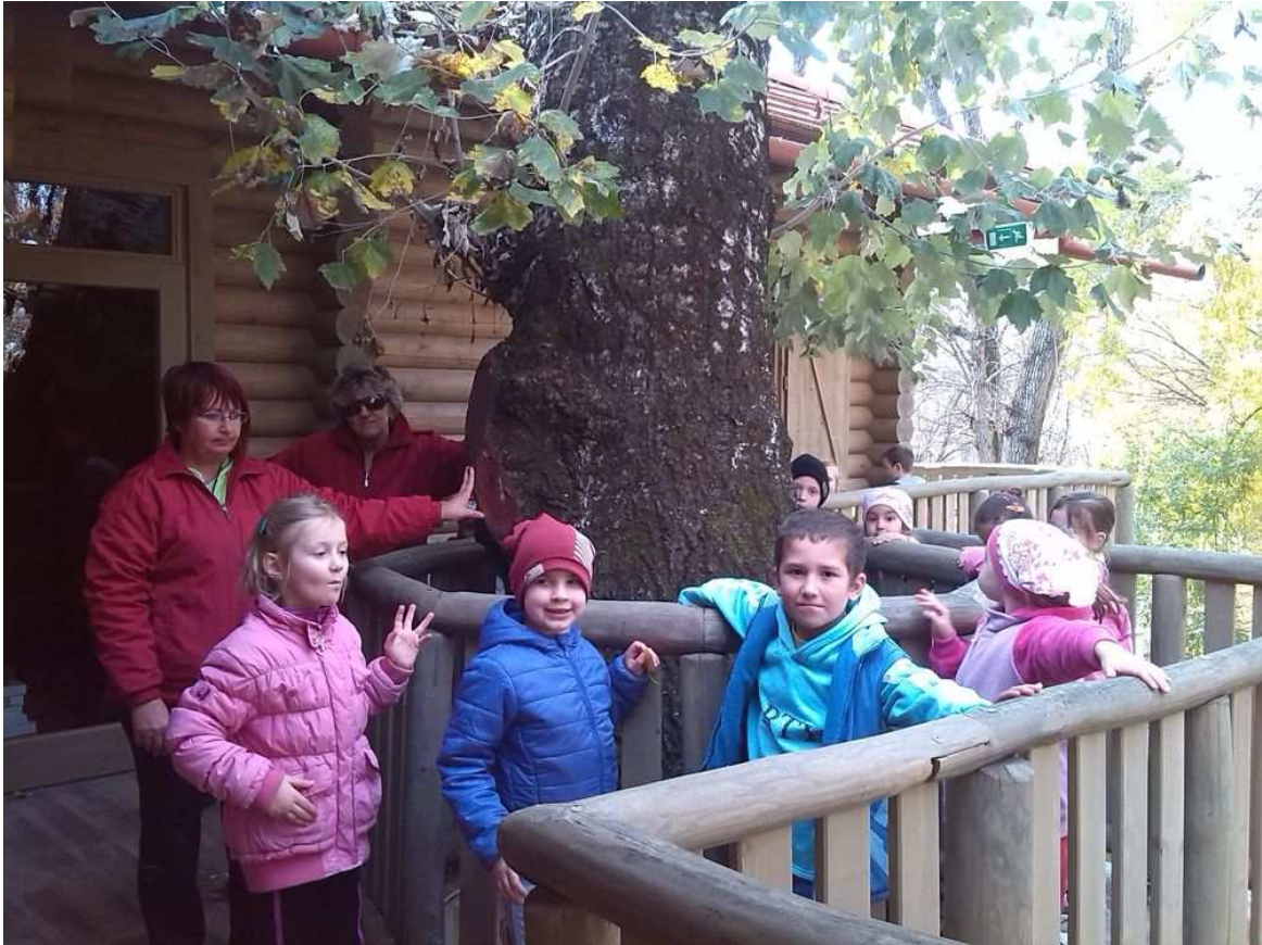
A Maros part is sok közös élményt nyújt