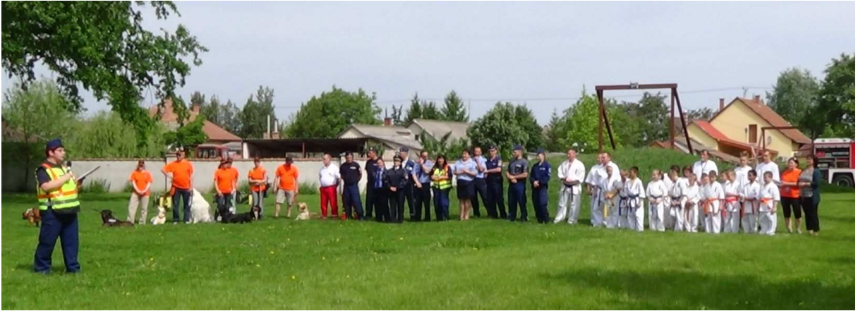
Bizalommal fordulok hozzád!