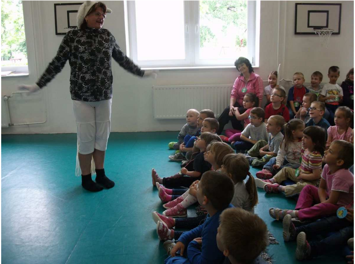
A „Tündérretikül” gyermeknapi előadása is elvarázsolta a gyerekeket