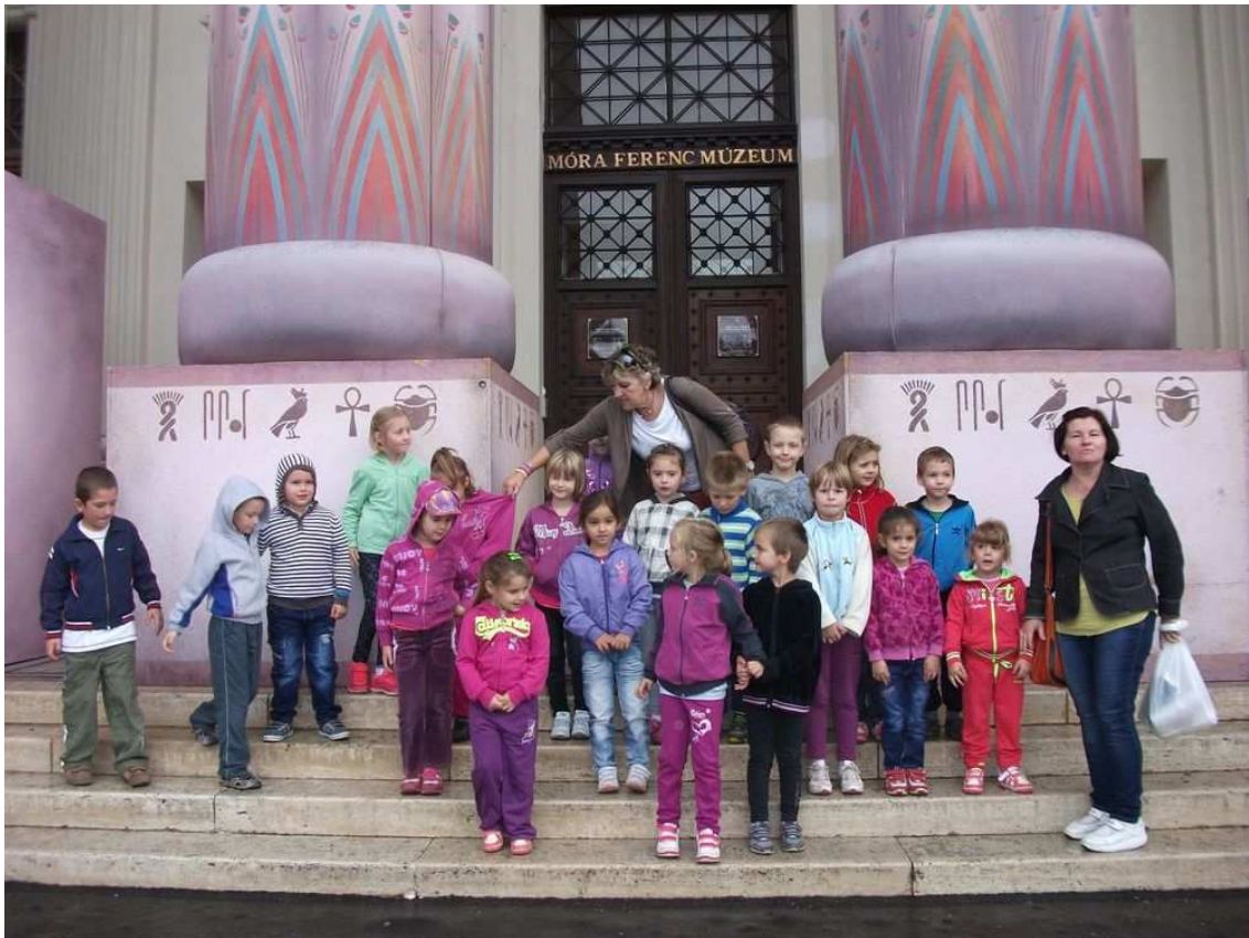
Nem csak Múzeumban, de Nemzeti Színházba is jártak!