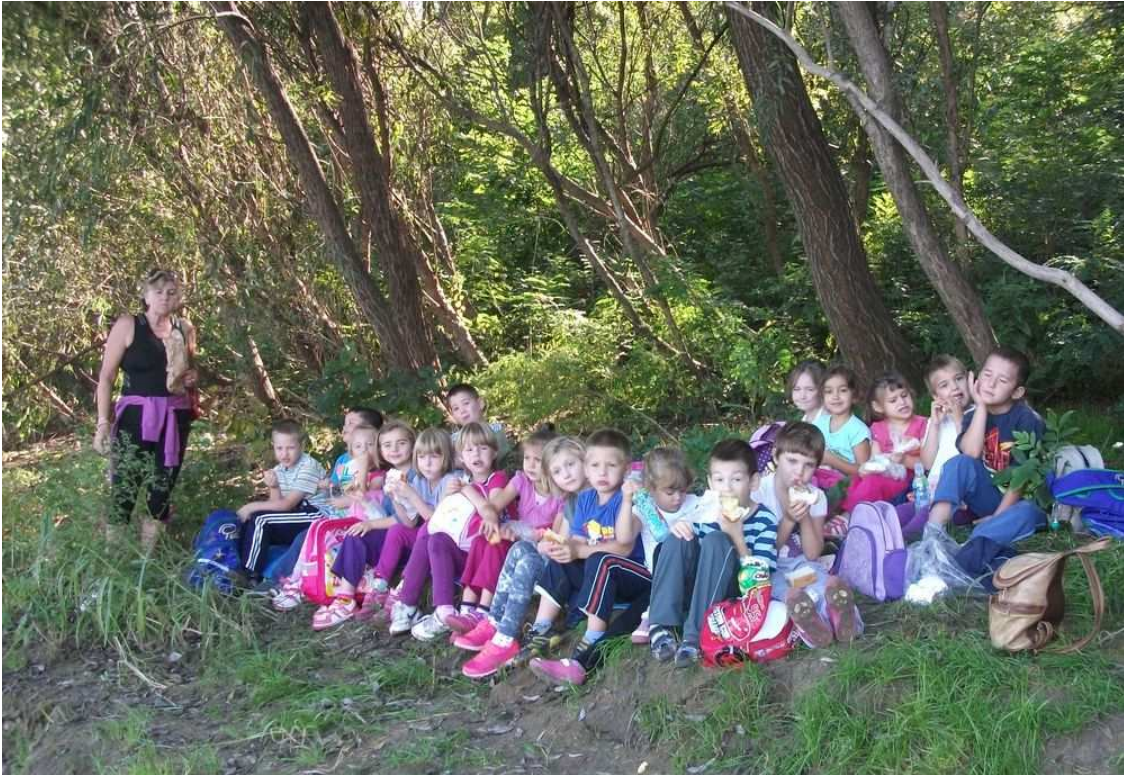
A Maros torkolatához jó időben, mert a Maros partra ősszel is jó kirándulni