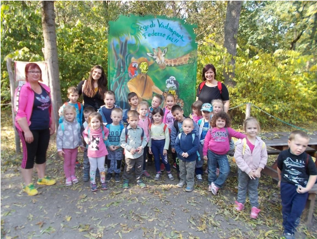
Vadasparkban is kirándultak csoportjaink