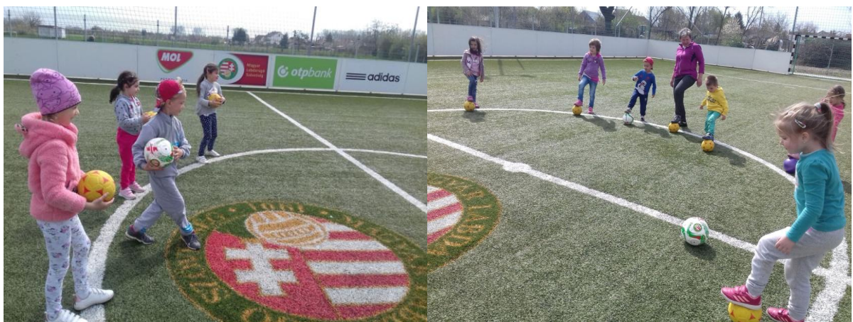
A műfüves pályán