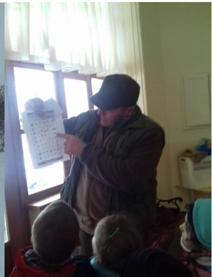
Vadetés télen és előadás az állatokrólnó és a kutyák is nagy kedvencek