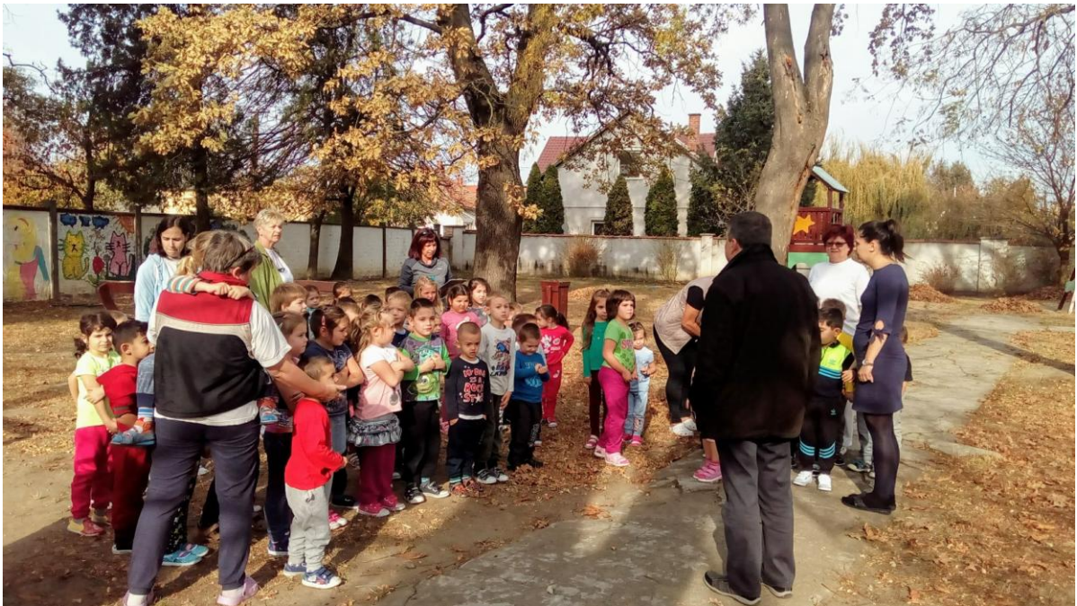
Tűzriadó próbát is tettünk