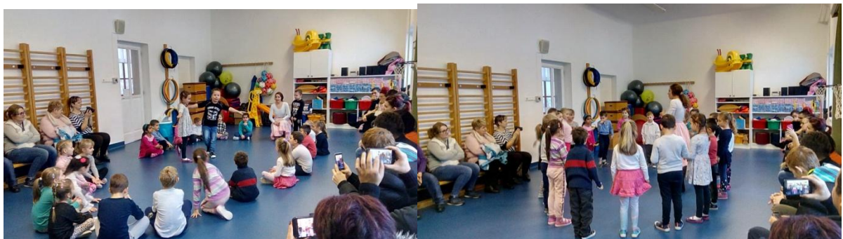
Néptánc bemutató a szülőknek