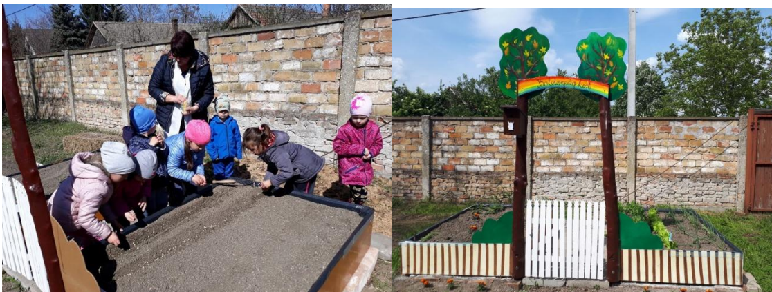
Önkéntes munkával készült el a „Boldogság kert” A növények ültetése, gondozása azóta a gyerekek folyamatos feladata.