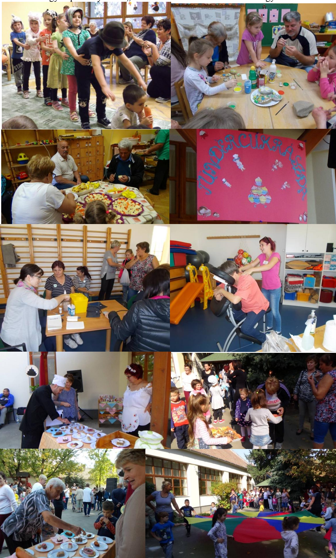
Egy napra kinyitott a „Tündércukrászda” a Kincset érő nagyikkal.