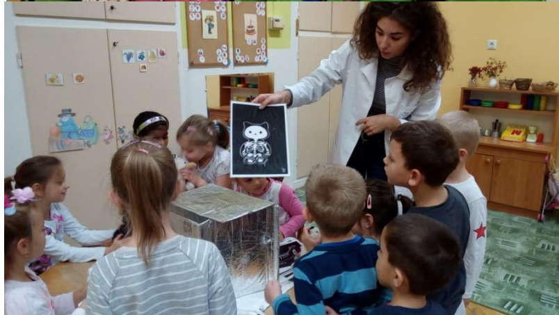
A „Teddy maci” program elvarázsolta a gyerekeket, és az orvostanhallgatók is örömmel foglalkoztak a kicsikkel.