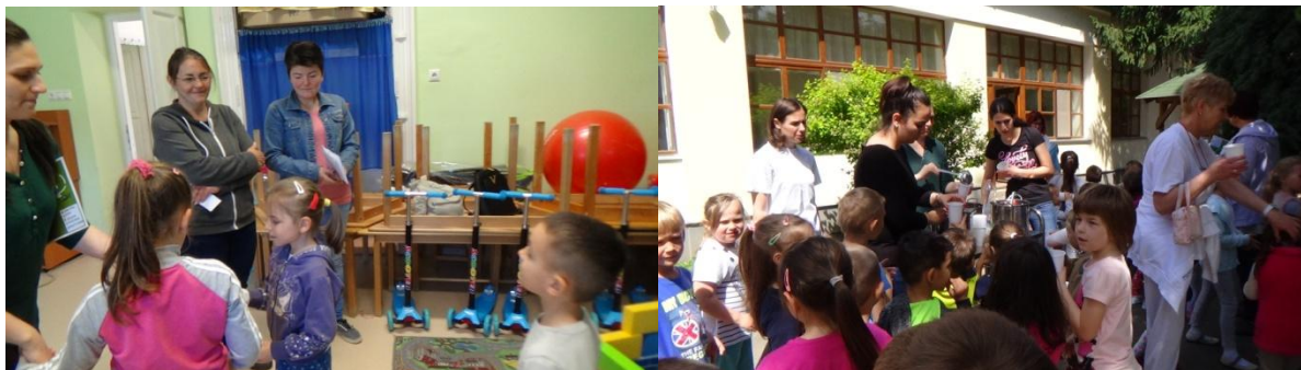
Akadályok elbontása és közös építés