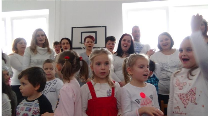
Karácsonyi hangverseny a szülőkkel