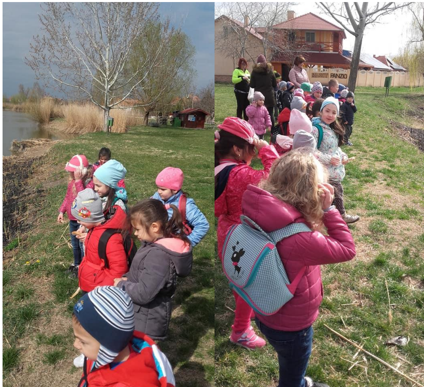
A víz világnapján