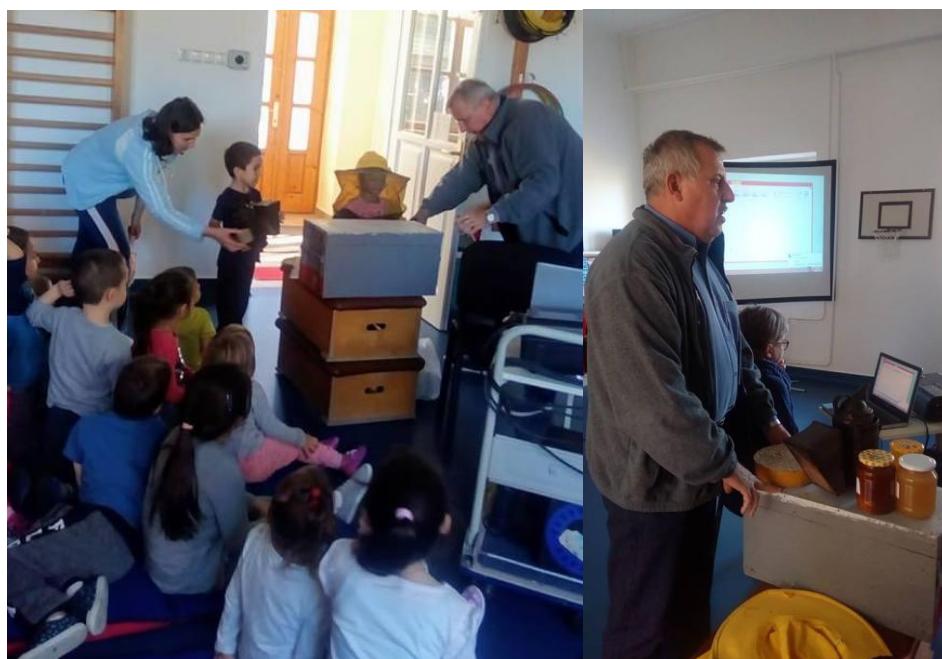
A „Mézes reggeli” program is új gyakorlati ismereteket nyújtott