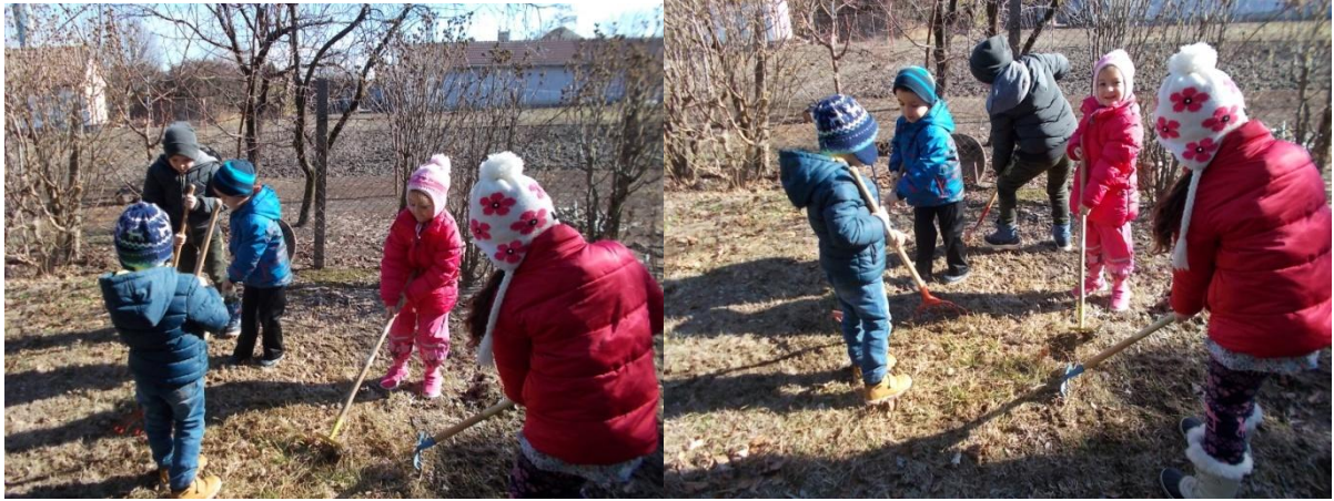
Munkára is neveljük a gyerekeket