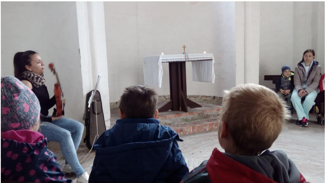
A zene világnapja alkalmából a Rotundában