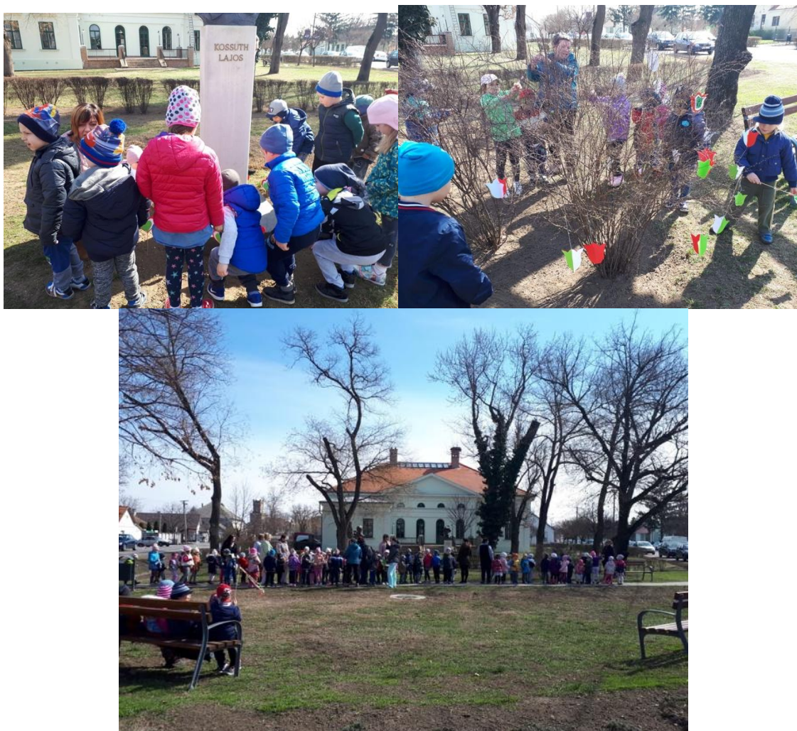
Ünnepi megemlékezés március 15-én