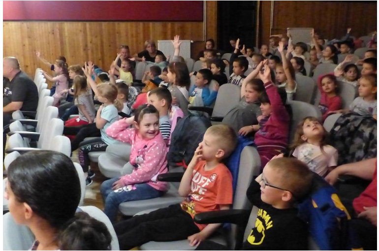
„Esélyteremtő óvoda” Műhelymunka és workshop