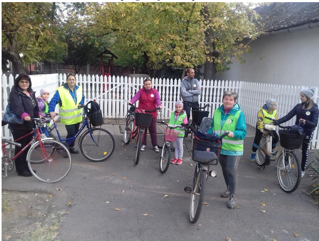
Kerékpároztunk a makói mentőkért