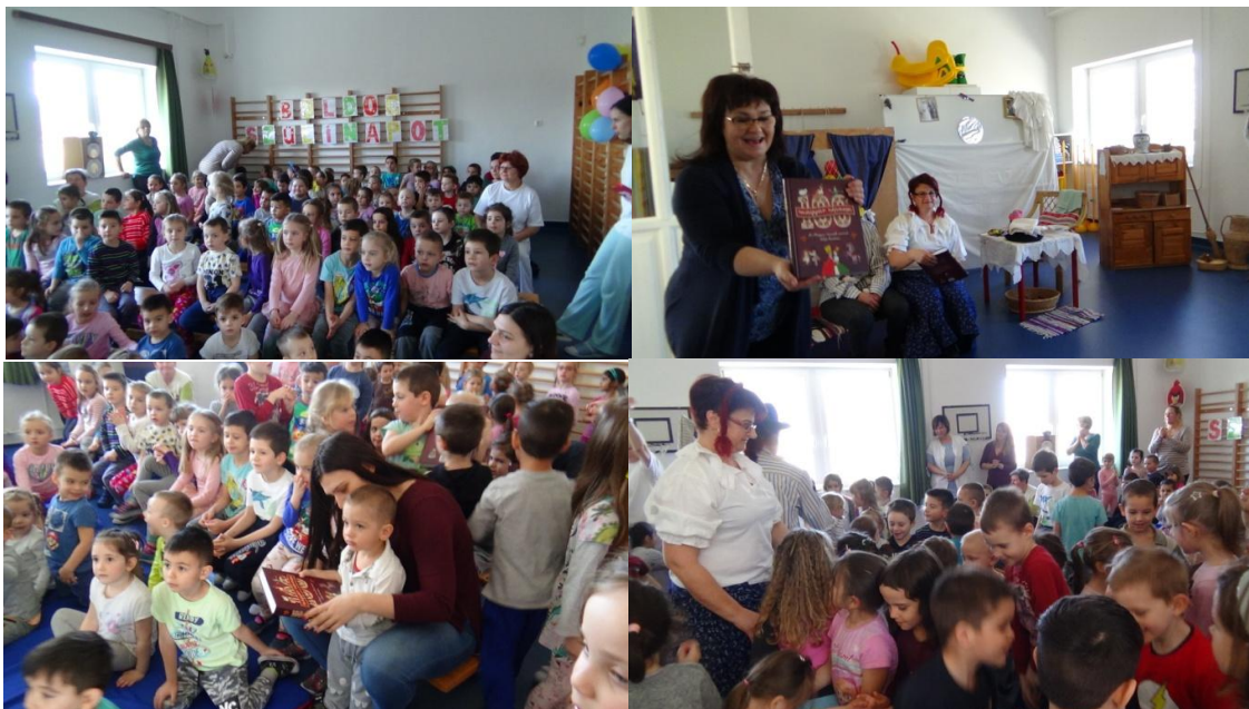
136. Ovi szülinap