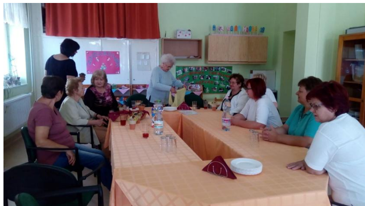
Nyugdíjasainkat is köszöntöttük