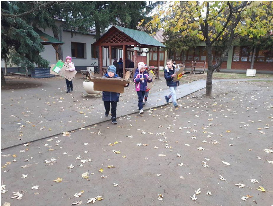
Ősszel is és tavasszal is gyűjtöttünk papírt