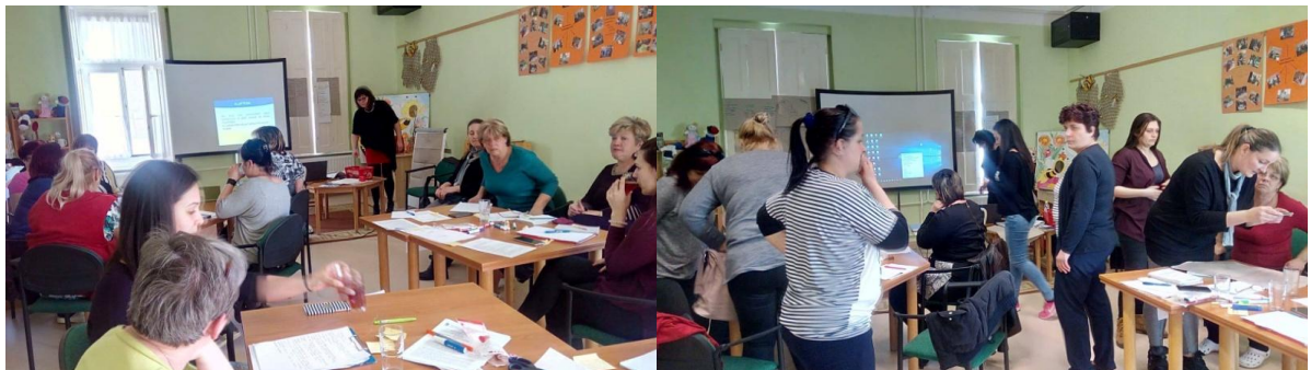
Akkreditált képzésben vett részt a nevelőtestület