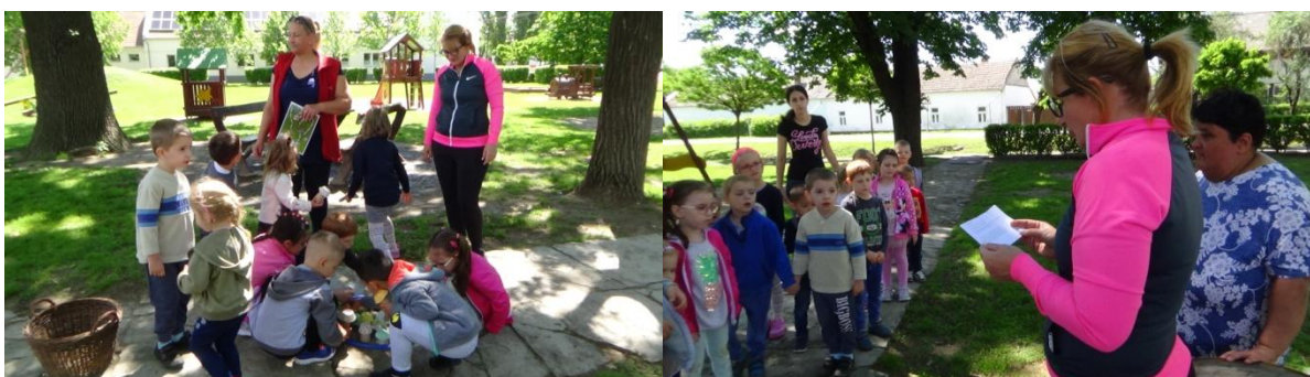
Készül Hami leve-se, kanállal viszik a hozzávalókat az ügyes kis törpök