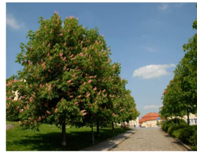
piros virágú, termés nélküli gesztenyefa