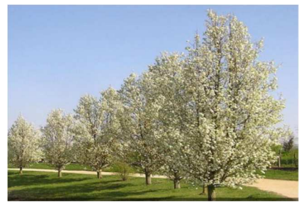
oszlopos díszkörte - Prunus calleriana Chant.