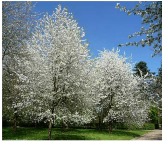
teltvirágú vadcsereznye - Prunus avium Plena , vagy