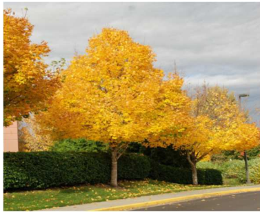
ezüshárs őszel, vagy