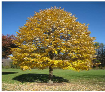
korai juhar fajta, vagy