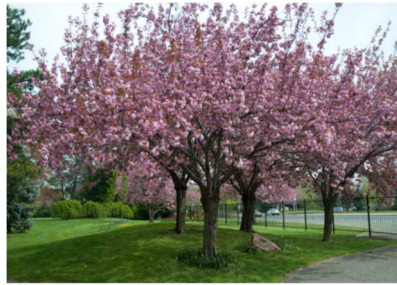
díszcsereznye - Prunus serrulata Kanzan , vagy